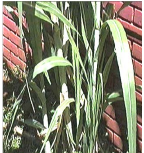
Albahaca mondonguera o de chivo