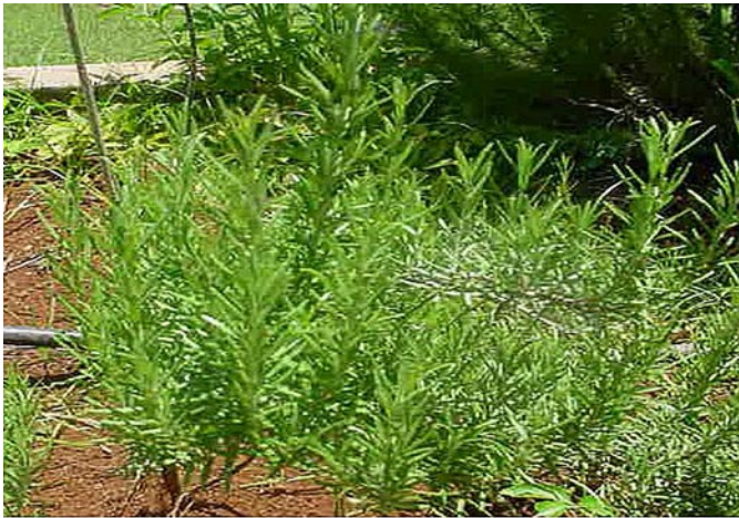
Romero. Forma parte de las plantas sagradas, usadas por Nasakó

Guira cimarrona. Mito Abakuá . Cuando los obones, en Usagaré, consagraban los sagrados atributos, se les presentó un espíritu malo, e Iyamba temeroso de un castigo, consultó con Nasakó, el adivino. Nasakó indagó que aquella aparición, era en efecto de un espíritu oscuro. Pero alejó la mala sombra con su poder, metió siete semillas dentro de guiro, agitándolo fuertemente y diciendo: Obiasa Abasí ona Ekué . Después se le entregó a Iyamba, y le aconsejó que al andar con el fundamento moviese siempre el guiro y repitiera -Obiasa Abasí ona Ekué-. También se cuenta que en la tierra Efik, en los varios ensayos que se llevaron a cabo para captar la voz divina, se emplearon un guiro, el pellejo de un pez y un cañamazo. También se utiliza como jícara.