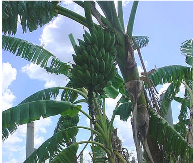
Plátano. Ingrediente de la mocuba o bebida ritual