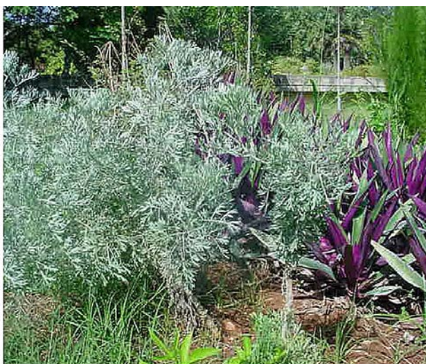
Incienso de costa. Saumió. Forma parte de las plantas sagradas, usadas por Nasakó Incienso