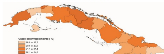
GRADO DE ENVEJECIMIENTO POR PROVINCIAS. AÑO 2020

Al finalizar el año 2020, todas las provincias del país presentaban un grado de envejecimiento que superaba al 18,9%, siendo la provincia de Artemisa la menos envejecida con un 19,0% y Villa Clara la más envejecida con 24,5%. En cuanto a los municipios, el más joven del país es Yateras, perteneciente a la provincia de Guantánamo con un 14,7%. Mientras que el más envejecido con un 28,9% es el capitalino Plaza de la Revolución (ONEI, 2020).