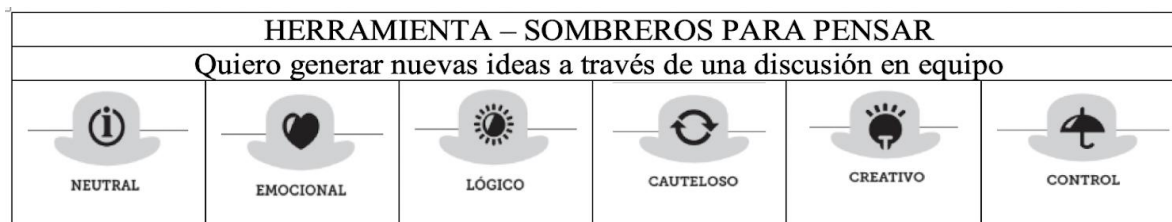
Figura 2. Herramienta sombreros para pensar

Esta herramienta permite incluir una gran variedad de puntos de vista y perspectivas mientras se mantiene el enfoque en un problema específico. Es una técnica que puede utilizarse para motivar a los estudiantes y separar el pensamiento en seis funciones o roles claros.